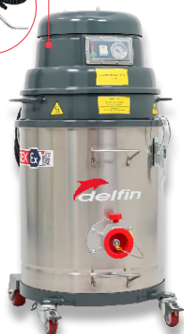
MTL 4535 Z22 Utilisation en zones de production